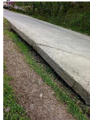
გზა კმ 17.728