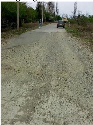
გზა კმ 17.274