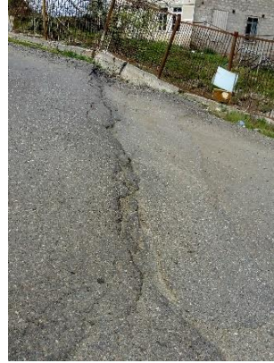
გზა კმ 14.655