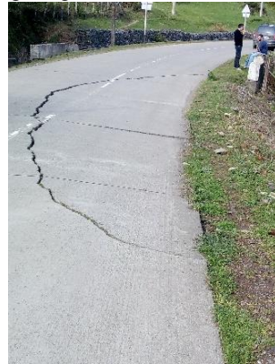
გზა კმ 16.380