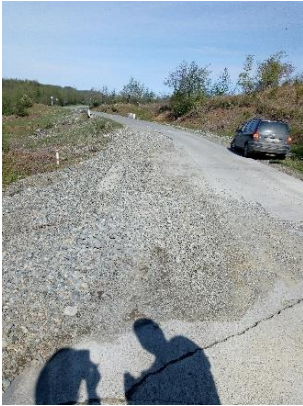
გზა კმ 4.541