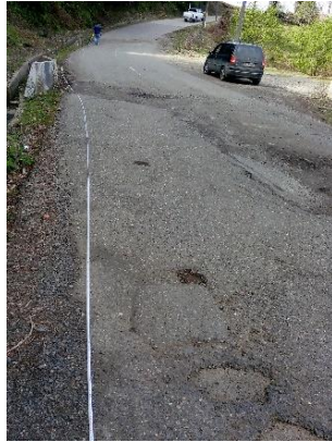
გზა კმ 14.284