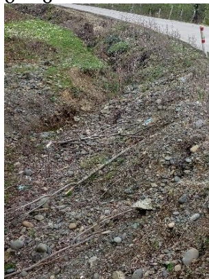
გზა კმ 17.425