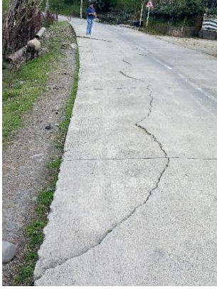
გზა კმ 17.765