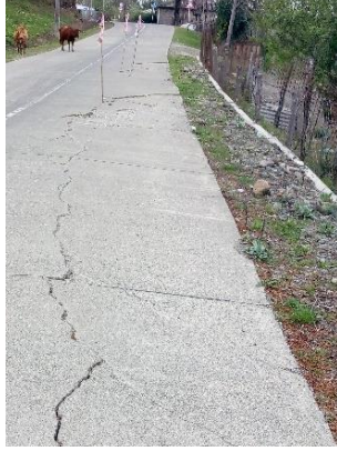
გზა კმ 18.260