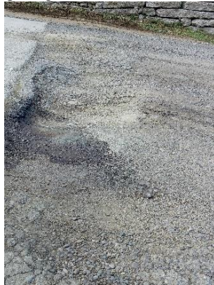
გზა კმ 15.070