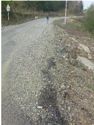
გზა კმ 14.890