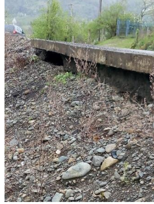
გზა კმ 19.150